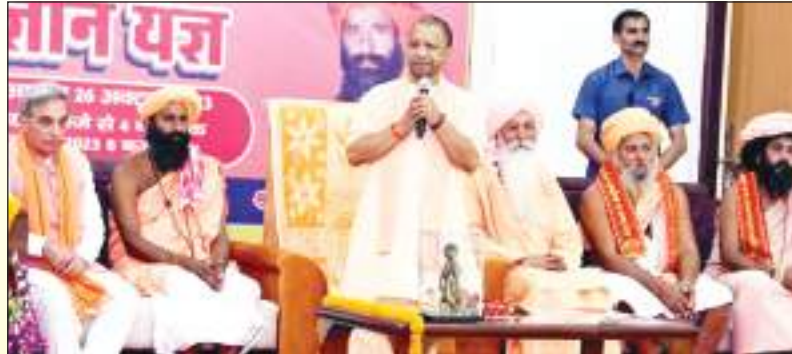
'ज्ञान यज्ञ' है। ये मोक्ष और मुक्ति से जुड़ा हुआ है। हम सब मुक्ति के लिए विभिन्न धाम और तीर्थों में जाकर कामना करते हैं। हम दान और यज्ञ भी मुक्ति की कामना से करते हैं।

गोरक्षनाथ के मंदिर और नवदुर्गा मंदिर में दर्शन-पूजन किया। साथ ही परिसर में रुद्राक्ष का पौधा रोपा। इसके अलावा उन्होंने भव्य सत्संग भवन का भी लोकार्पण किया। ज्ञान यज्ञ है श्रीमद्भागवत महापुराण: अपने उद्बोधन में मुख्यमंत्री ने कहा कि बागपत की धरती का महत्व महाभारत कालीन है। श्रीकृष्ण ने जिन पांच ग्रामों को दुर्योधन से मांगा था, उसमें बागपत की धरती भी शामिल है। सीएम योगी ने कहा कि हाल ही में प्रदेश में विजयदशमी का पर्व संपन्न हुआ है। ये सत्य, धर्म और न्याय की विजय का पर्व है। मुख्यमंत्री ने श्रीमद्भागवत महापुराण कथा के शुभारंभ पर कहा कि ये महापुराण असल में