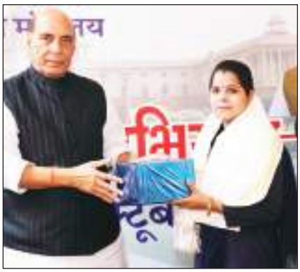
केंद्रीय रक्षा मंत्री राजनाथ सिंह एक कार्यक्रम में सम्मानित करते हुए।